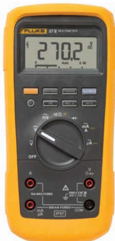
Fluke 27 II