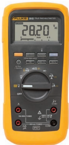
Fluke 28 II